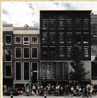
Hiša, v kateri se je skrivala družina Frank v Amsterdamu, je danes muzej.

Edini, ki je vojno preživel, je bil oče Otto. Vrnil se je v Amsterdam, našel hčerin dnevnik in ga objavil v njen spomin. Tako je junija 1947 prvič izšel Dnevnik Ane Frank , ki je postal velika uspešnica in ena najbolj znanih knjig na svetu. Prevedli so ga v približno sedemdeset jezikov, po njem so prirejali gledališke, televizijske in filmske predstave. Leta 1960 je bilo skrivališče preurejeno v muzej z imenom Hiša Ane Frank . Anin oče je do svoje smrti sodeloval z muzejem. Njegova glavna želja – da ljudje z branjem knjige spoznajo nevarnosti, ki jih prinašajo diskriminacija, rasizem in sovražstvo – se je uresničila v celoti.