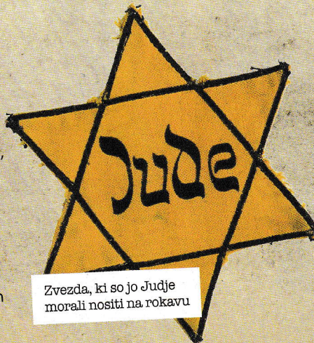
Zvezda, ki so jo Judje morali nositi na rokavu

Ana je začela pisati dnevnik mesec dni pred umikom v skrivališče. V zelo utesnjenem prostoru se je petindvajset mesecev stiskalo osem ljudi. Skrivališče je bilo narejeno v zadnjem delu