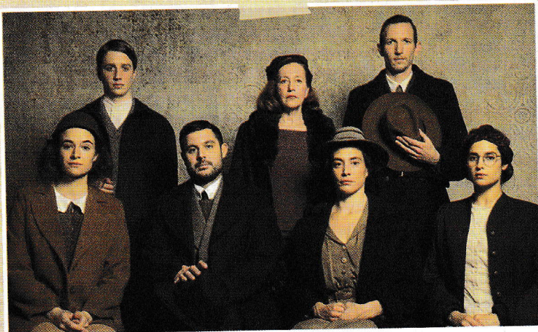
Po knjigi Dnevnik Ane Frank je bilo že veliko uprizoritev. Na fotografiji je uprizoritev v ljubljanskem Mini teatru iz lanskega leta.

hiše, spredaj so bili poslovni prostori očetovega nekdanjega podjetja za predelovanje sadja. Nenehno so morali paziti, da šepetajo, ne kihajo, hodijo tiho in se ne izdajo. Zato je bil dnevnik Ani največja opora. Na prvo stran je zapisala: »Oh, kako sem vesela, da sem te vzela s seboj!« Dnevnik je napisan v obliki pism namišljeni prijateljici Kitty. Vsebuje smešne in žalostne stvari. Piše o vsem – o nizozemskem vsakdanjem življenju, dogodkih, povezanih z vojno, odnosih med ljudmi v skrivališču in o svojem odrasčanju. Tako si lajša osamljenost in utesnenost. Spoznava, da se v prisiljeni zaprtosti , v kateri se z družino znajdejo, slišijo žaljive besede in nestrpnost. Piše o tem, kako v teh zahtevnih okoliščinah dojema svoje telo, mladostništvo, potrebo po nežnosti, prijateljstvu. Opisuje zahtevne odnose z mamo – v največjo oporo ji je oče. In ja, piše tudi o ljubezni. Težko ji je – navajena je na drugačno življenje. Vendar – čuti varnost in zaradi tega je hvaležna. Svoje življenje zdaj razume kot priložnost za spoznavanje realnosti: »Ano, šolarko prejšnjega časa, zdaj vidim kot očarljivo, a zelo površno dekle, ki nima nič več skupnega z mano ...« Ko postane bolj resna, se začne zavedati želje po lepoti in dobroti. Razmere jo oblikujejo v odgovorno osebo. Večino svojega časa v skrivališču namenja svojemu dnevniku – branju, pisanju in urejanju zapisov v njem. Želi postati novinarka, uživa v pisanju: »Če se bo izkazalo, da nimam talenta za pisanje