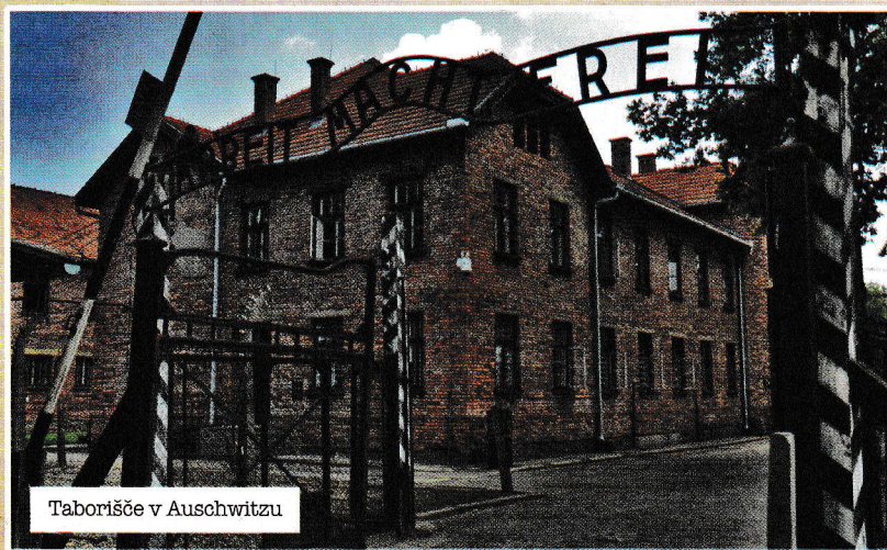
Taborišče v Auschwitzu