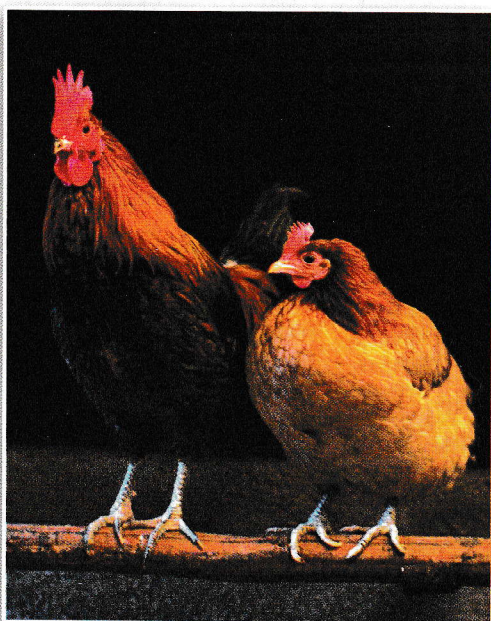
Samec in samica udomačene kokoši se na zunaj najbolj razlikujeta po velikosti ter grebenu - mesnatem izrastku na glavi. Ta je različnih oblik, a je pri petelinih vedno večji.

uvrščeni petelini pridno čakajo, da svojo jutranjo pesem odpoje glavni in lahko nato z njo nadaljujejo še sami. Znanstveniki so odkrili, da imajo petelini biološko notranjo uro, ki natančno zaznava, kdaj se bo začel dan. Ura je uravnana tako, da zaznava tudi spremembe v dolžini dneva skozi leto. To pomeni, da poleti začno svojo budnico že praktično sredi noči.