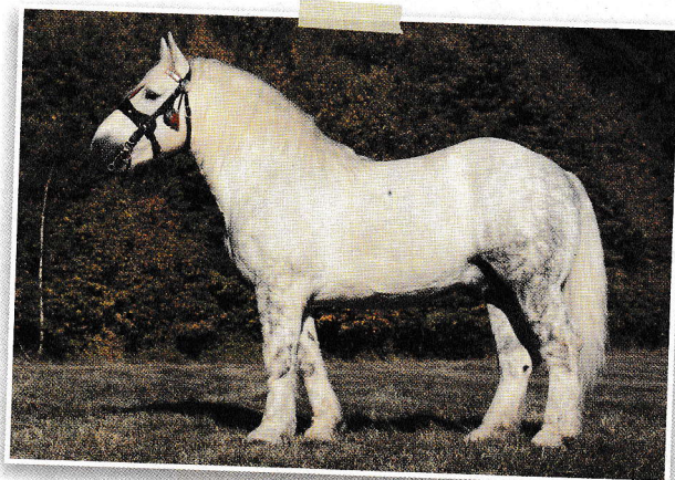
Hladnokrvni vlečni konj

polnokrvnimi in hladnokrvnimi, ki so jih vzgojili za posebne vrste jahanja. Čeprav so polnokrvneži visoki in lahki, hladnokrvneži težki in poniji lahko zelo majhni, so vsi ti konji predstavniki iste biološke vrste. In seveda, konji so kot sesalci toplokrvne živali in njihove »krvne« oznake kažejo le na njihov značaj in ne na telesno temperaturo.